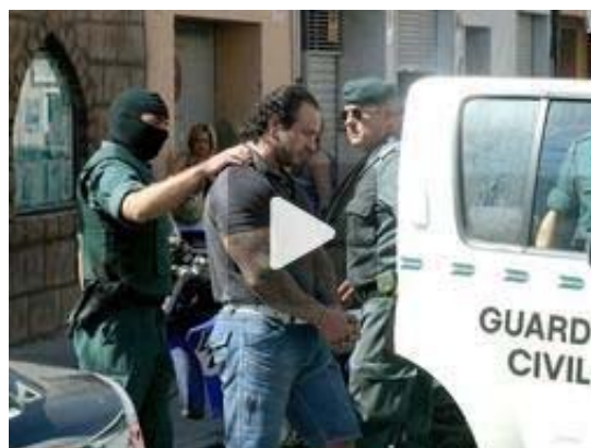
Un presunto miembro de la red, el martes, cuando fue detenido en Eida.

La Guardia Civil, apoyada por unidades especialistas de las Comandancias de Valencia, Alicante, Madrid, y Coruña, así como por la Agrupación Rural de Seguridad, se ha incautado de más de 50.000 euros en efectivo, 200 cajas de hormonas de crecimiento humano importada ilegalmente desde China, principios activos, excipientes y utensilios utilizados para el envasado de productos y anabolizantes, esteroides y hormonas, entre otros efectos.