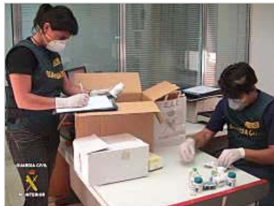
Dos guardias civiles examinan algunos de los anabolizantes y compuestos farmacológicos intervenidos durante la operación Pantxi .

La operación se ha saldado finalmente con 15 detenidos (10 de ellos en la Comunitat) y 3 imputados. Entre los arrestados se encuentra el seleccionador nacional de culturismo, apresado en Elche, que quedó igualmente en libertad. Pero hay también "jueces de competición, ganadores de recientes certámenes de culturismo" y propietarios de tiendas de complementos energéticos, como consta en la nota de Interior.