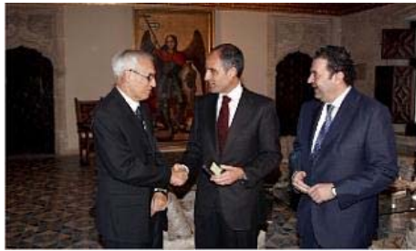
entrega. El Síndic, Rafael Vicente, da al presidente Camps y al titular de Economía, la auditoria en una memoria USB. gv

El Síndic reitera un año más que el aumento del gasto sanitario, junto con los "problemas estructurales derivados de una financiación insuficiente", "no ajustada a la realidad demográfica actual", tiene su reflejo en las