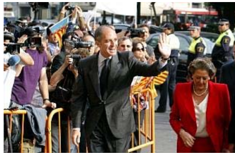
El presidente Francisco Camps saluda al público que le recibió el día que fue a declarar.

La agenda del Presidente de la Generalitat ha dejado sin coartada a Francisco Camps al situarle en Valencia, en actos oficiales, en las distintas fechas en las que fueron cobrados los trajes, entre enero y febrero de 2007. Este abono lo realizó personalmente y en efectivo en una tienda de Forever Young en Madrid, según manifestó el mismo Presidente ante el juez que investiga la trama Gürtel en Valencia, por un presunto delito de cohecho, cuando declaró como imputado en el Tribunal Superior de Justicia de la Comunitat Valenciana.