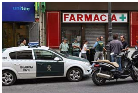
registro. Agentes de la Guardia Civil en la farmacia de Valencia registrada. José aleixandre

Tanto las sustancias en polvo como los fármacos y prospectos intervenidos en la botica y en el resto de los establecimientos registrados serán ahora analizados por los agentes, al igual que la abundante documentación confiscada en esta operación policial, en la que se demuestra dónde conseguían la materia prima para elaborar los productos ilegales.