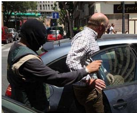
Un agente traslada ayer a uno de los detenidos en Valencia JOSE ALEIXANDRE

TERESA DOMÍNGUEZ Agentes de la Unidad Central Operativa (UCO) de la Guardia Civil detuvieron ayer en Valencia a un médico, un farmacéutico y a dos personas más por su presunta vinculación con una red de distribución de anabolizantes que operaba en las tres provincias de la Comunidad Valenciana, según pudo saber este diario de fuentes de toda solvencia. La operación, desarrollada ayer por la mañana, incluyó el registro de una farmacia ubicada en el número 14 de la avenida del Puerto de Valencia, de donde los investigadores se llevaron numerosas cajas que contenían anabolizantes y otros medicamentos de los utilizados por aficionados al culturismo.