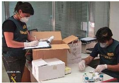
registro. Dos agentes de la UCO levantan acta de los fármacos incautados.

La Guardia Civil intervino en torno a "un millón de dosis" durante el dismantelamiento de la red presuntamente dedicada al tráfico ilegal de anabolizantes, esteroides y complejos hormonales dirigidos a aumentar artificialmente la masa muscular. Así lo afirmó ayer en Madrid un responsable del cuerpo durante la rueda de prensa para informar acerca de esta operación, bautizada como Pantxi y desarrollada en Valencia, Alicante, Madrid y A Coruña, tal como ha venido informando Levante-EMV.