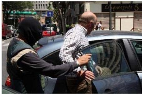
arrestado. Un guardia escolta a uno de los detenidos mientras entra en un coche camuflado. José aleixandre

Ésta es la segunda operación de estas características que tiene por escenario Valencia en los últimos ocho meses. El pasado 16 de septiembre, agentes del mismo grupo arrestaban a quince personas por su presunta pertenencia a una trama que vendía anabolizantes y otros compuestos hormonales también desde una farmacia de Valencia, aunque en esa ocasión, el negocio se encontraba en el centro de la ciudad.