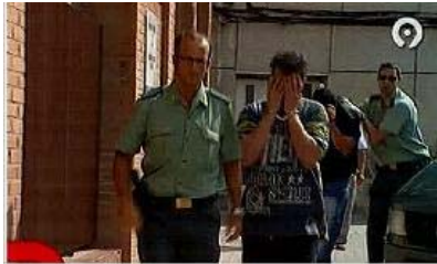
al juzgado. Dos de los detenidos, a su llegada a los juzgados de Elda. canal 9

En todos los casos, las actuaciones y los arrestados serán puestos a disposición judicial del Juzgado de Instrucción número 4 de Leganés (Madrid), que centralizará las investigaciones contra esta supuesta red acusada de los delitos de tráfico ilegal de medicamentos y tráfico de drogas.