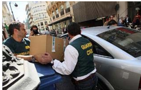
decomiso. Dos agentes trasladan una de las cajas repleta de productos supuestamente ilegales confiscados en el almacén de la botica de Pascual y Genís.

Tanto las sustancias en polvo como los fármacos y prospectos intervenidos en la botica y en el resto de los establecimientos registrados serán ahora analizados por los agentes, al igual que la abundante documentación confiscada en esta operación policial, en la que se demuestra dónde conseguían la materia prima para elaborar los productos ilegales.