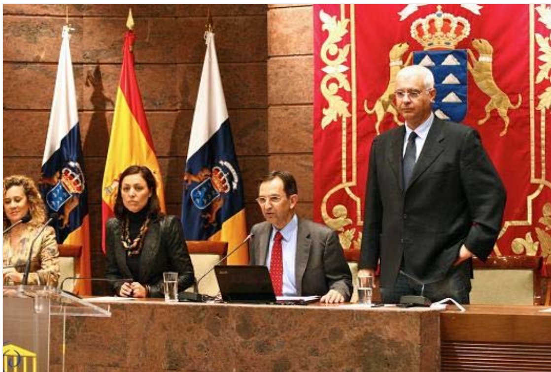
Momento del Pleno Extraordinario que duró unos diez minutos.