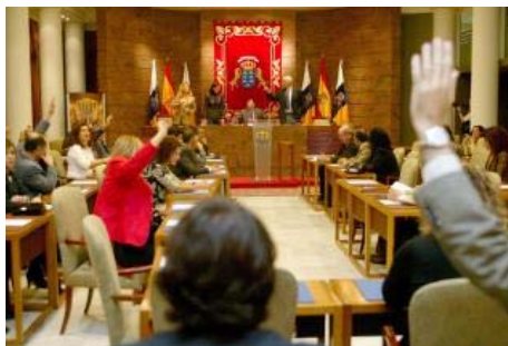
Los diputados de CC y PP votan ayer a favor de las enmiendas que faltaban para aprobar la modificación de la Ley de Ordenación de Turismo.