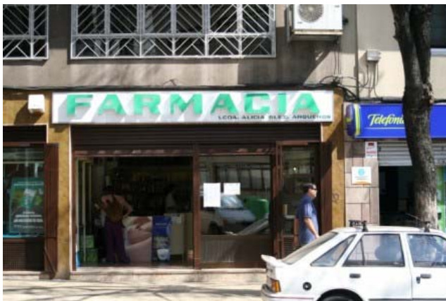
Una farmacia en Santa Cruz de Tenerife.