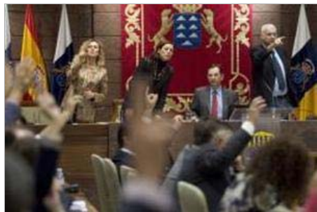
Manos alzadas de los diputados regionales mientras la Mesa cuenta votos