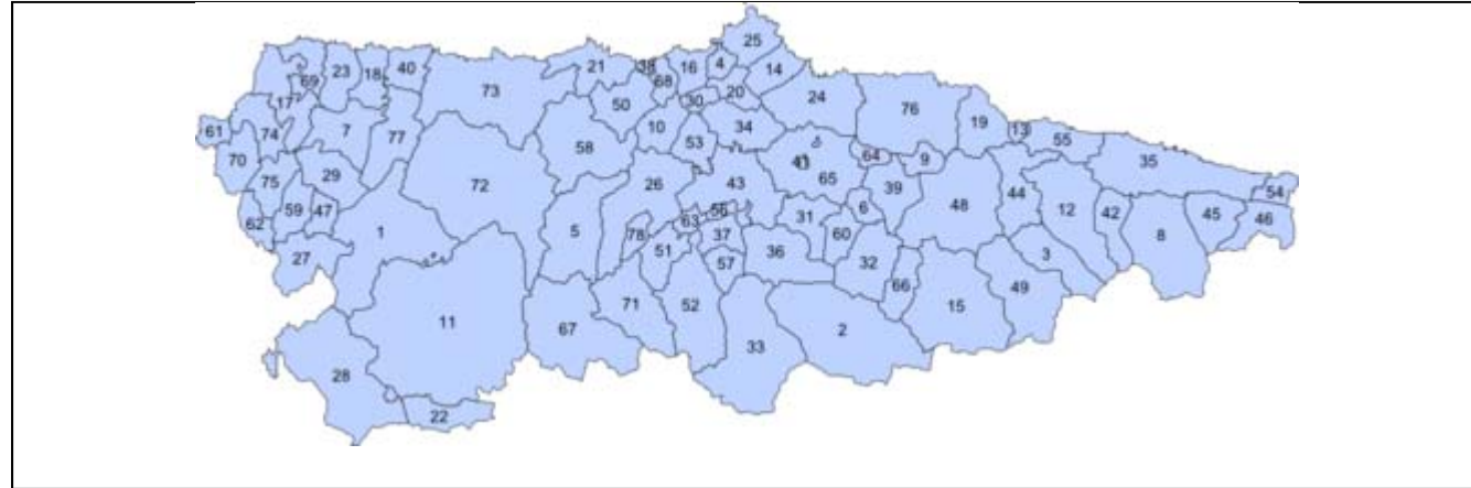
Mapa municipal de Asturias con los concejos señalados