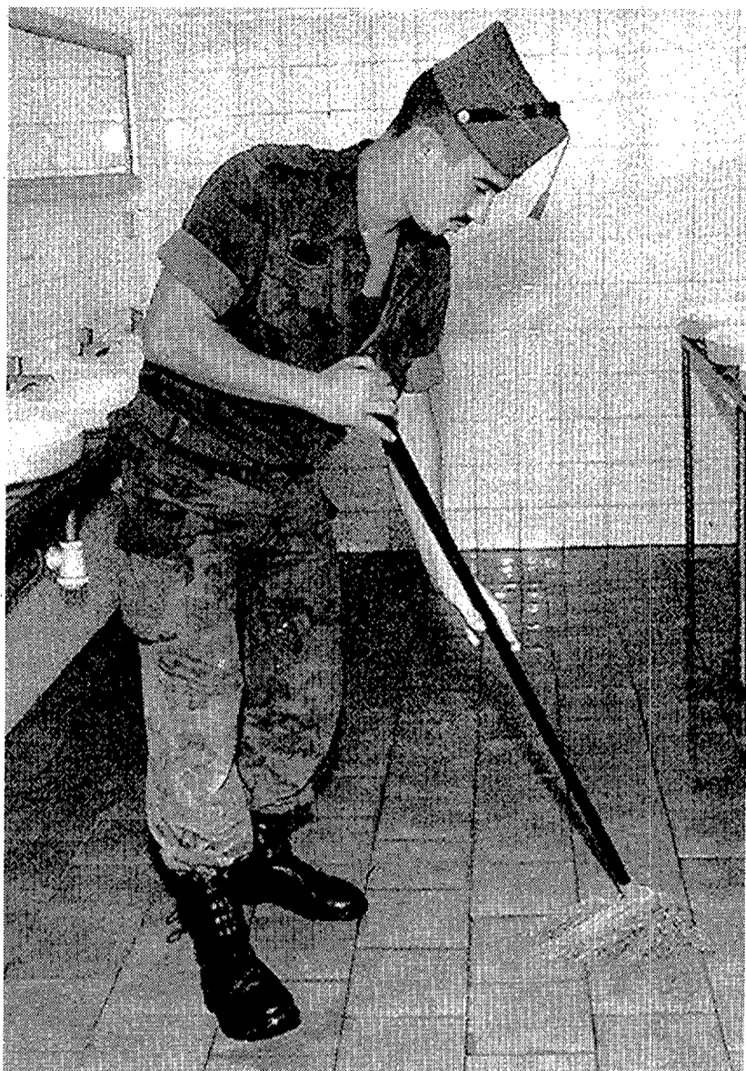
El nuevo cupo de excedentes no superaría los 2.000 mozos, según CiU e IU

Las mismas fuentes subrayan que el motivo del retraso se debe a que, aunque cuentan con el apoyo de CiU para que no se repita el sorteo, con lo que la propuesta de los socialistas no tiene posibilidades de salir adelante, los nacionalistas catalanes piden alguna solución, como la del sorteo parcial entre los perjudicados, que el ministerio, por lo menos de momento, no considera posible. Dichas fuentes del ministerio insis-