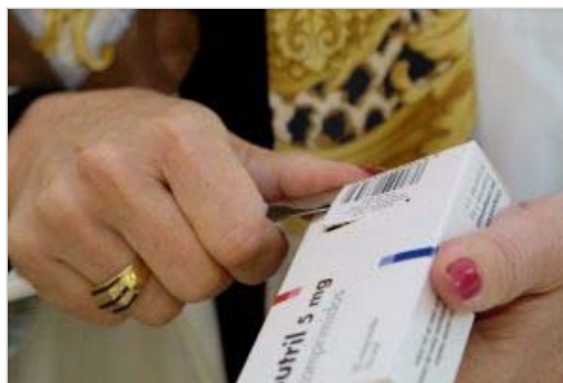
Una farmacéutica corta los códigos de barras durante al venta de un medicamento.

Un estudio elaborado por la Fundación Alternativas aboga por abolir la «redundante e ineficaz exigencia» de tener la titulación específica para ostentar la propiedad de una oficina de farmacia, una posición defendida por los colegios de farmacéuticos y otras organizaciones que representan a los farmacéuticos propietarios.