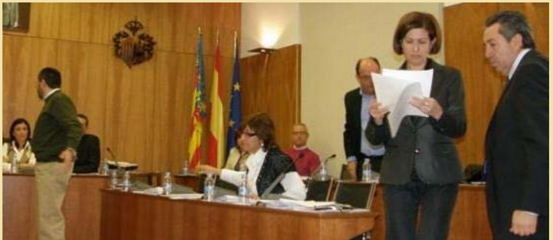
El Pleno Municipal de hoy tuvo un receso para aclarar dudas

El informe que argumenta los beneficios para solicitar la adhesión de la Catedral de Orihuela en la red de “Ciudades Catedralicias” ha generado las protestas de los grupos de la oposición, al apreciar errores en datos históricos y errores en la redacción del texto.